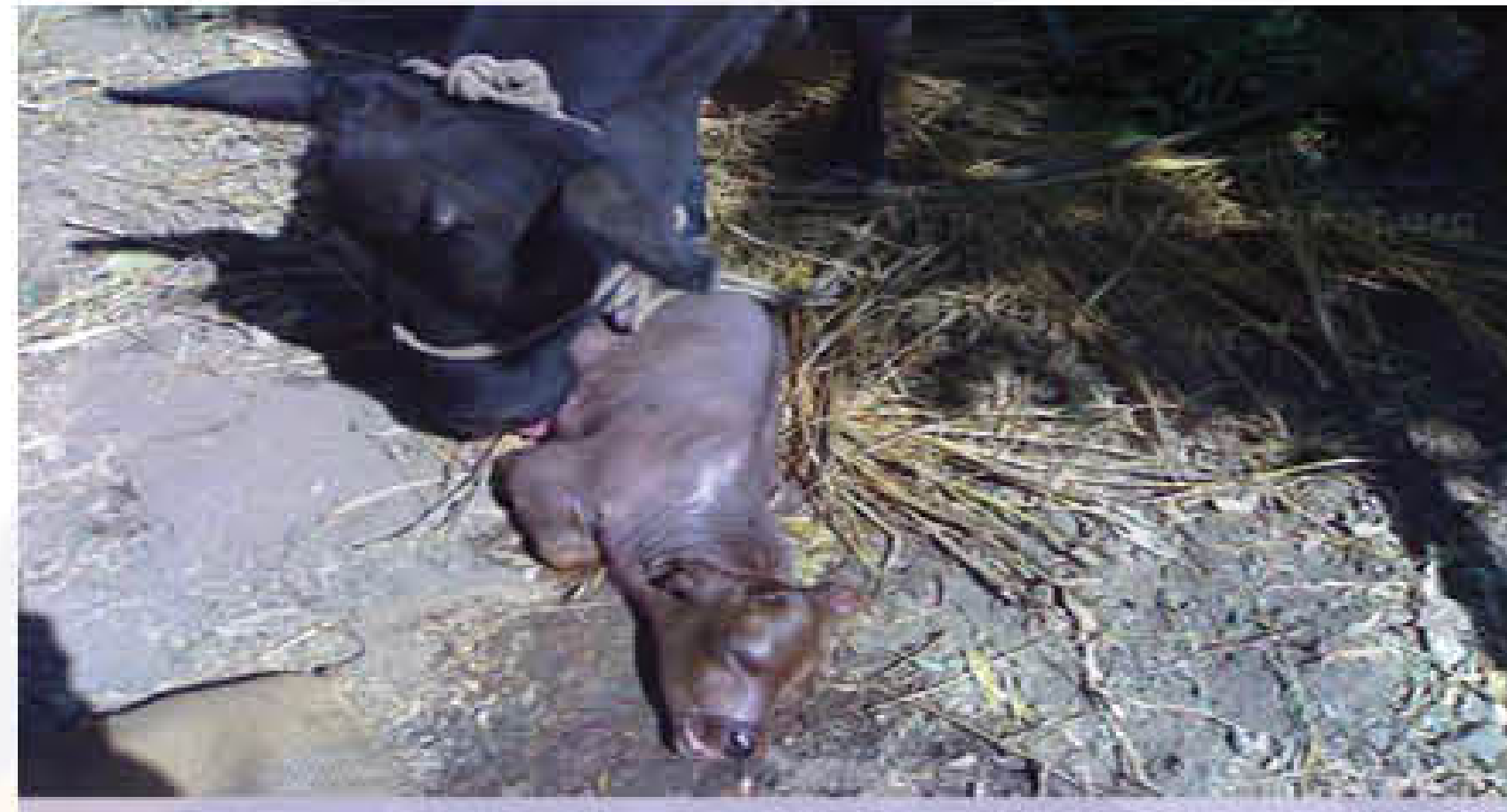
जन्म से पहले गर्भपात