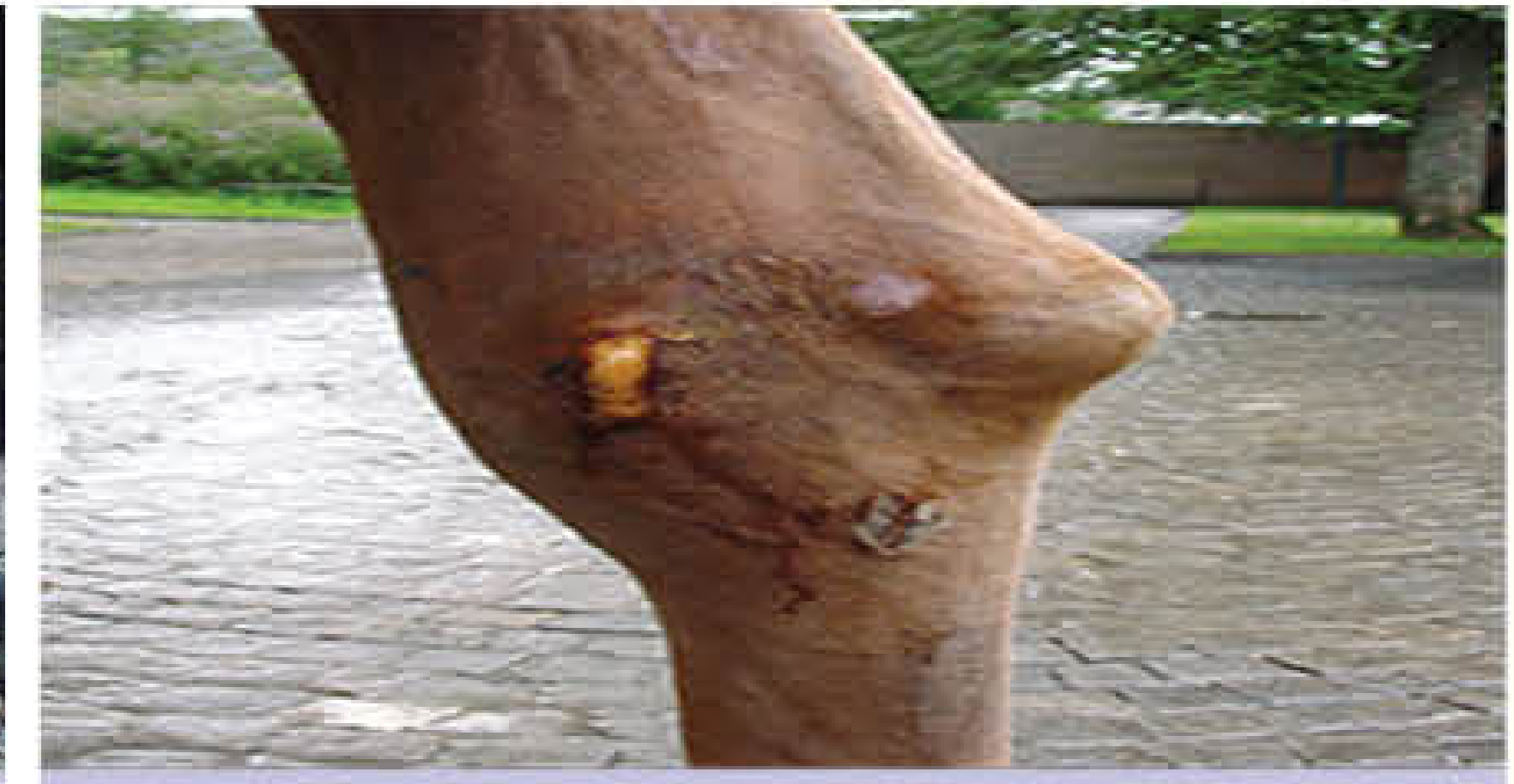
जोड़ों में सूजन और मवाज़ का बनना