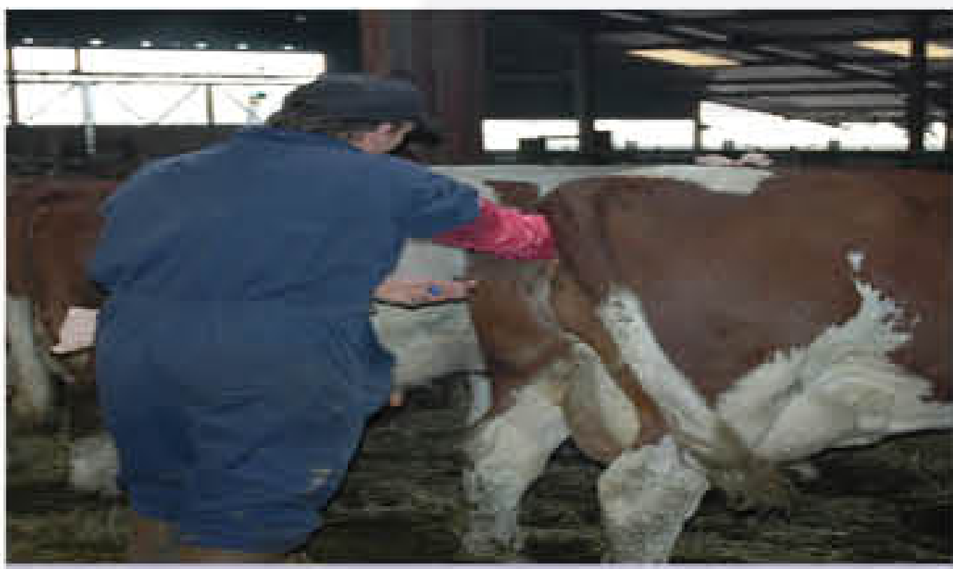
कृत्रिम गर्भाधान कराए