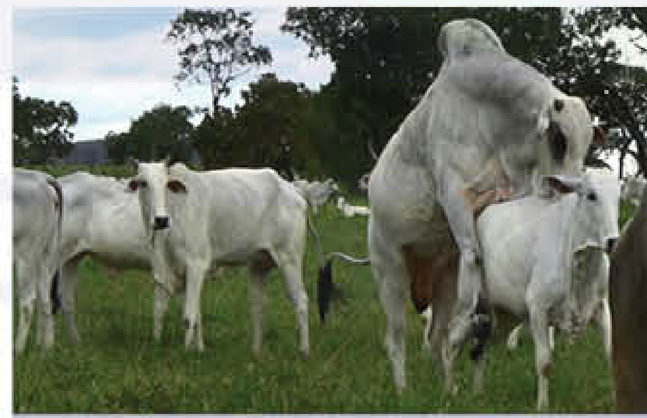
ब्रूसेल्ला मुक्त सांड से ही प्रजनन कराए