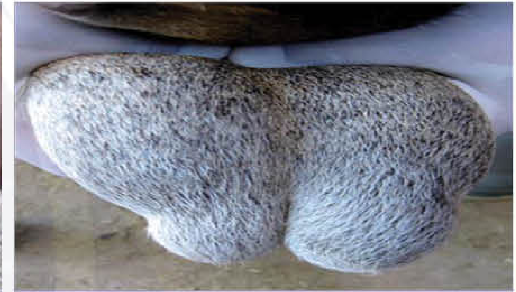
नर भेड़ के वृषण में सूजन