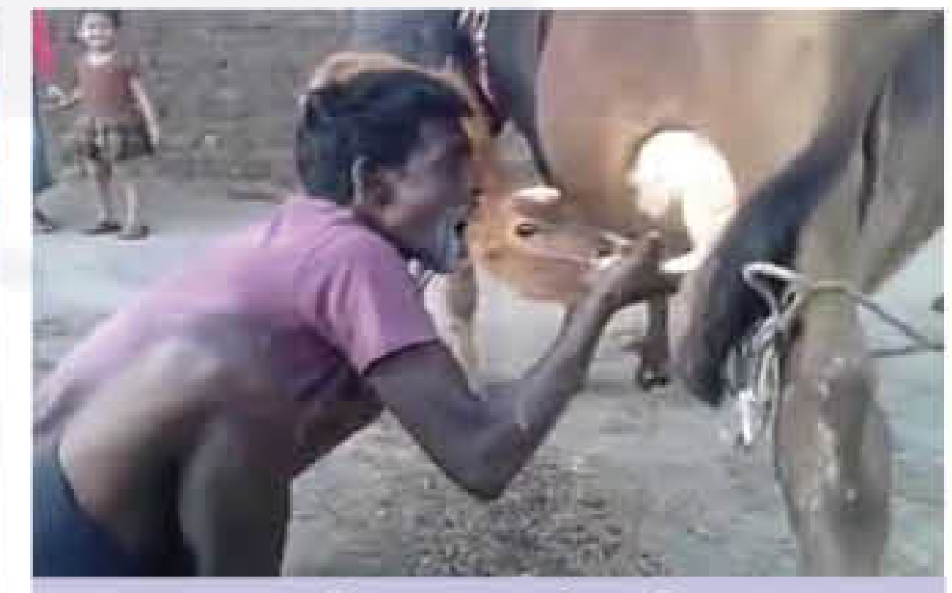
दूध बिना उबाले न पिए