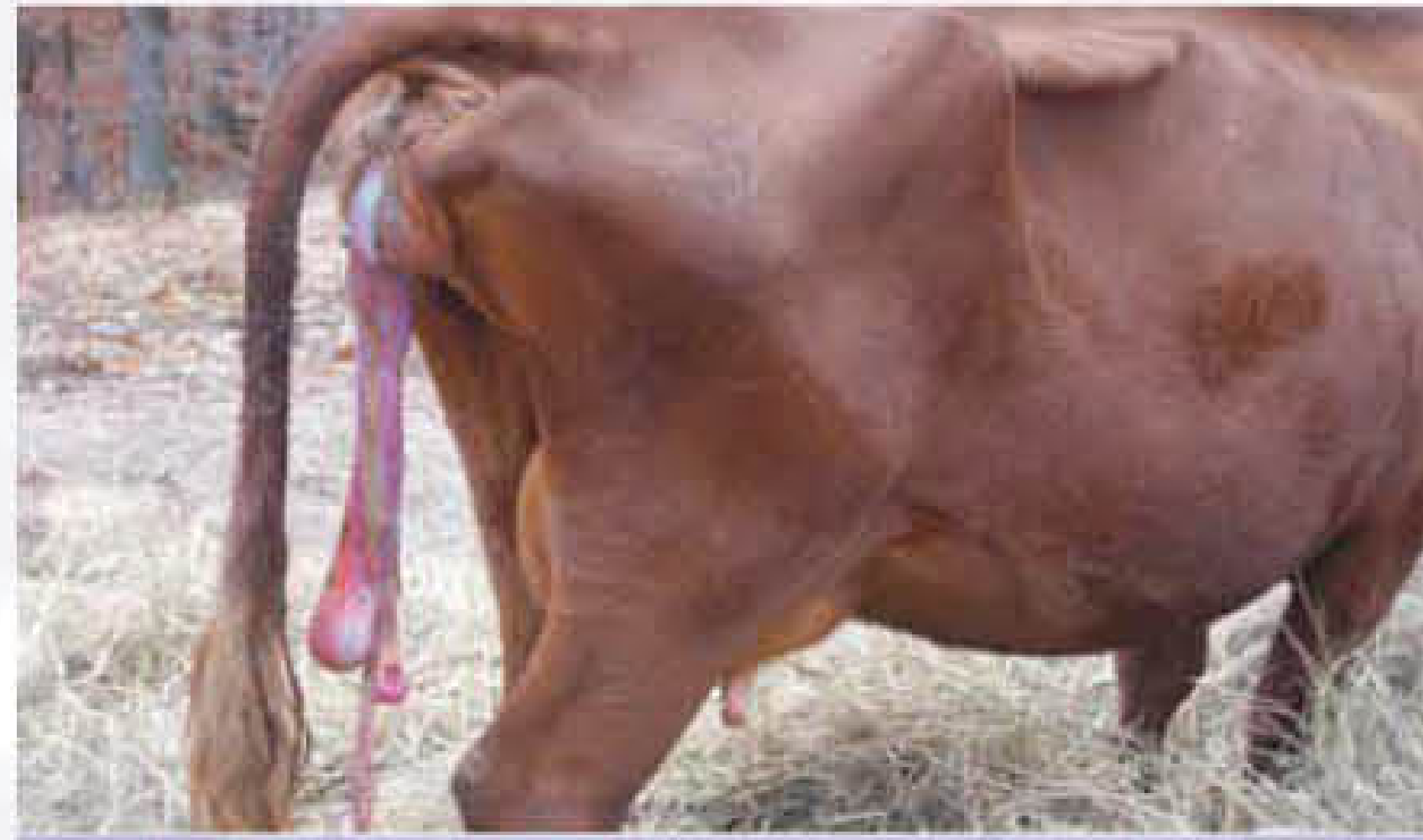
गर्भपात के बाद खेड़ी का बाहर न आना