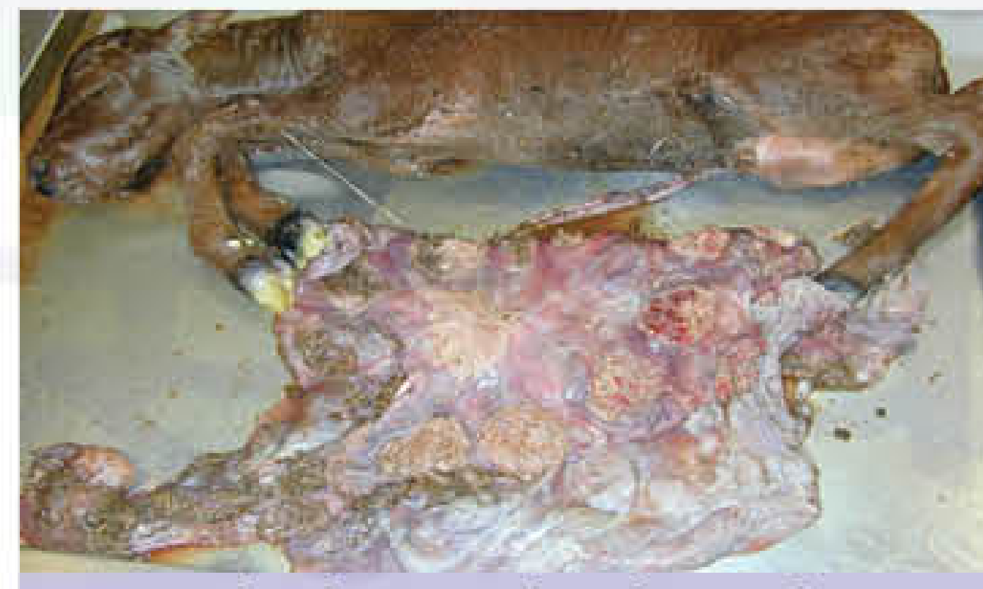
मृत बछड़े और जर को खुले हाथ से न छूए